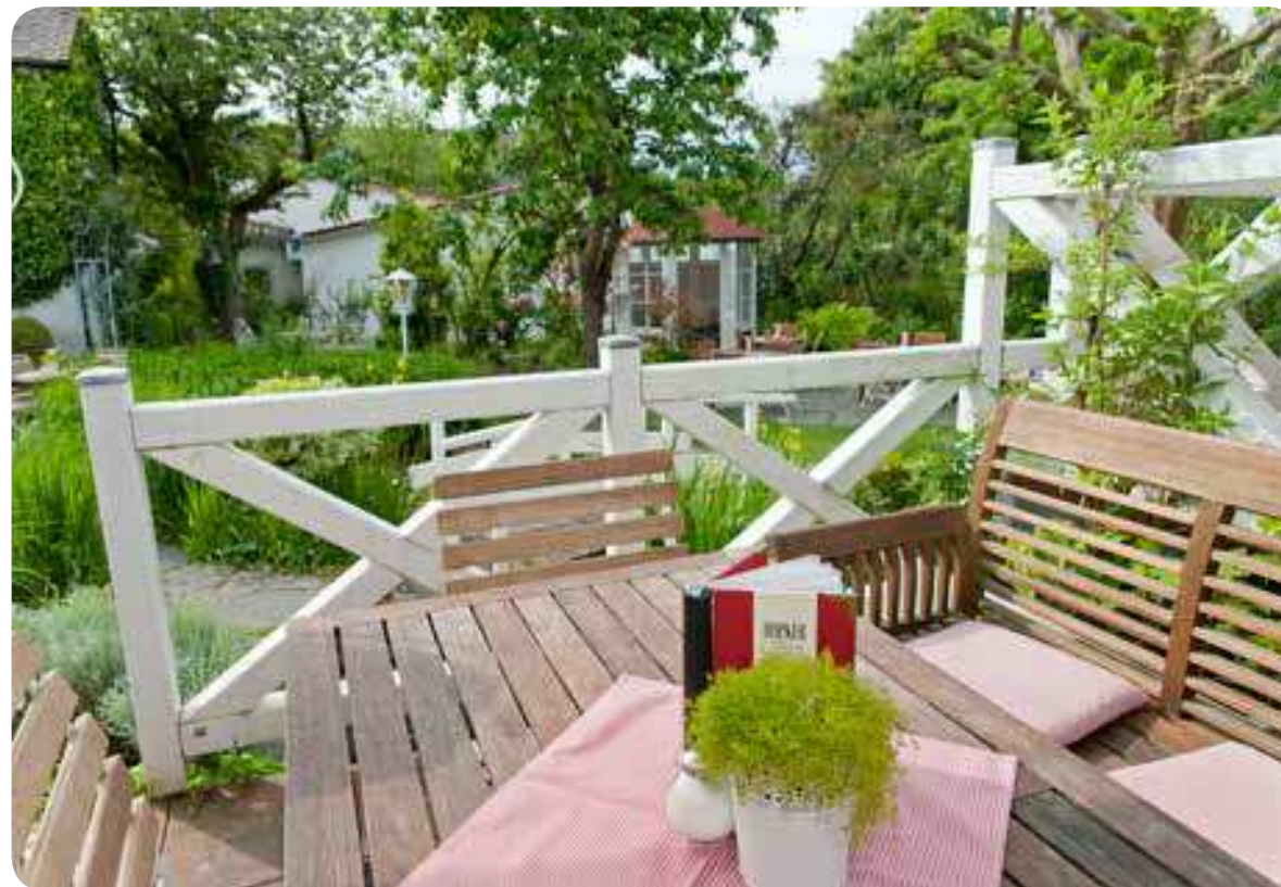
Ruhe vor dem Sturm: Ist es Sonntag, wird auch der idyllische Garten schnell voll – das „Königliche Frühstücksbuffet“ ruft.